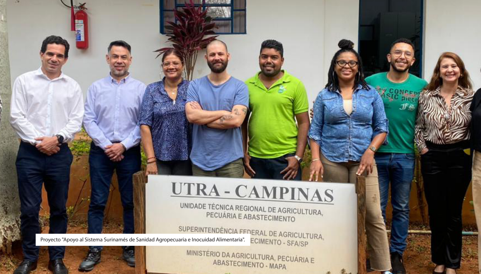
Proyecto "Apoyo al Sistema Surinamés de Sanidad Agropecuaria e Inocuidad Alimentaria".