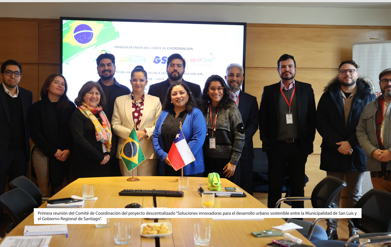
Primera reunión del Comité de Coordinación del proyecto descentralizado “Soluciones innovadoras para el desarrollo urbano sostenible entre la Municipalidad de San Luis y el Gobierno Regional de Santiago”.

Actualmente, y en el marco de lo aprobado en la II Reunión del Grupo de Trabajo, se ejecuta el proyecto descentralizado “Soluciones innovadoras para el desarrollo urbano sostenible entre la Municipalidad de San Luis y el Gobierno Regional de Santiago”, proyecto que apunta al manejo de residuos domésticos.