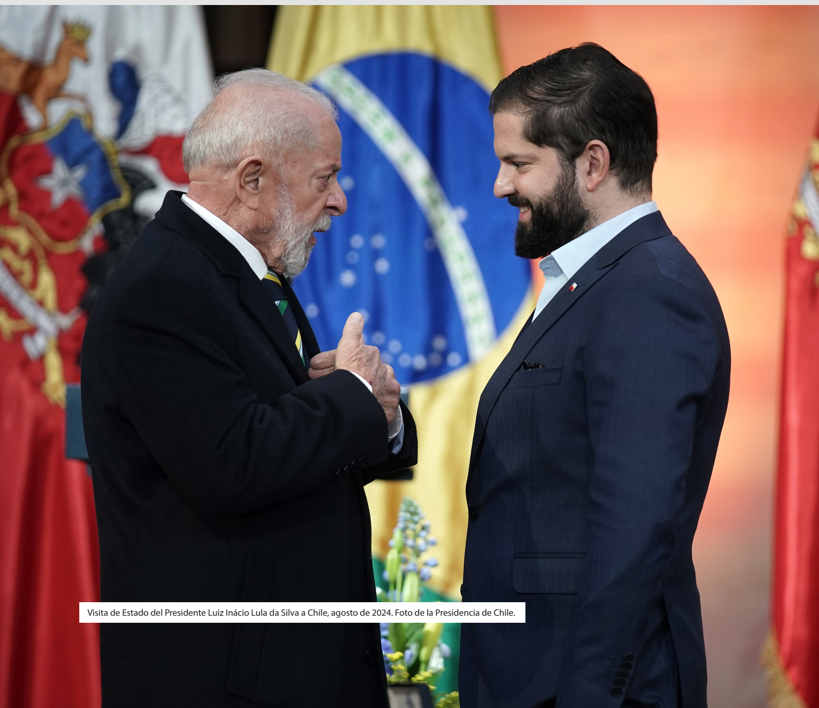
Visita de Estado del Presidente Luiz Inácio Lula da Silva a Chile, agosto de 2024.

Además, durante la visita de Estado del presidente Luiz Inácio Lula da Silva a Chile, en agosto de 2024, se firman 19 acuerdos en áreas como extradición, licencias de conducir, cooperación diplomática, derechos humanos, turismo, salud, ciencia, comercio, ciberseguridad y energía.