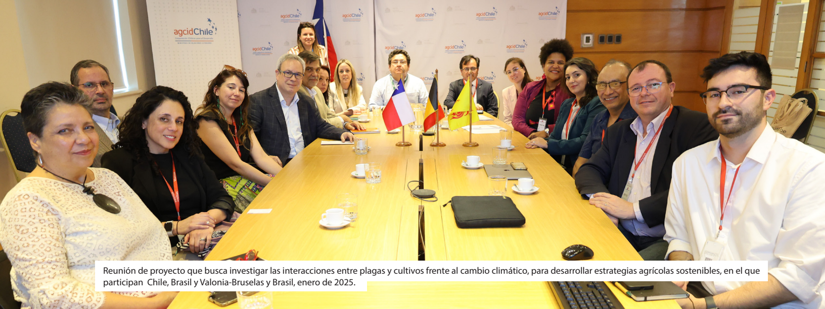
Reunión de proyecto que busca investigar las interacciones entre plagas y cultivos frente al cambio climático, para desarrollar estrategias agrícolas sostenibles, en el que participan Chile, Brasil y Valonia-Bruselas y Brasil, enero de 2025.