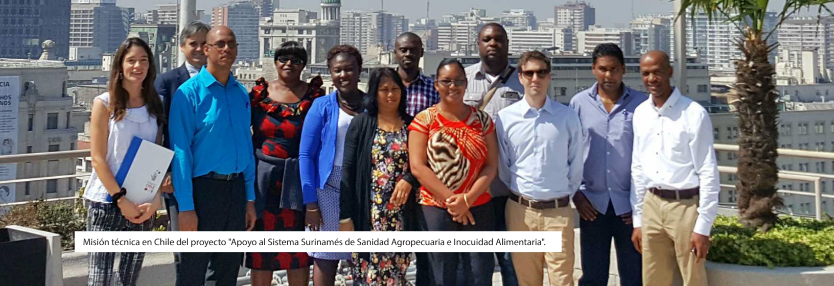
Misión técnica en Chile del proyecto "Apoyo al Sistema Surinamés de Sanidad Agropecuaria e Inocuidad Alimentaria".