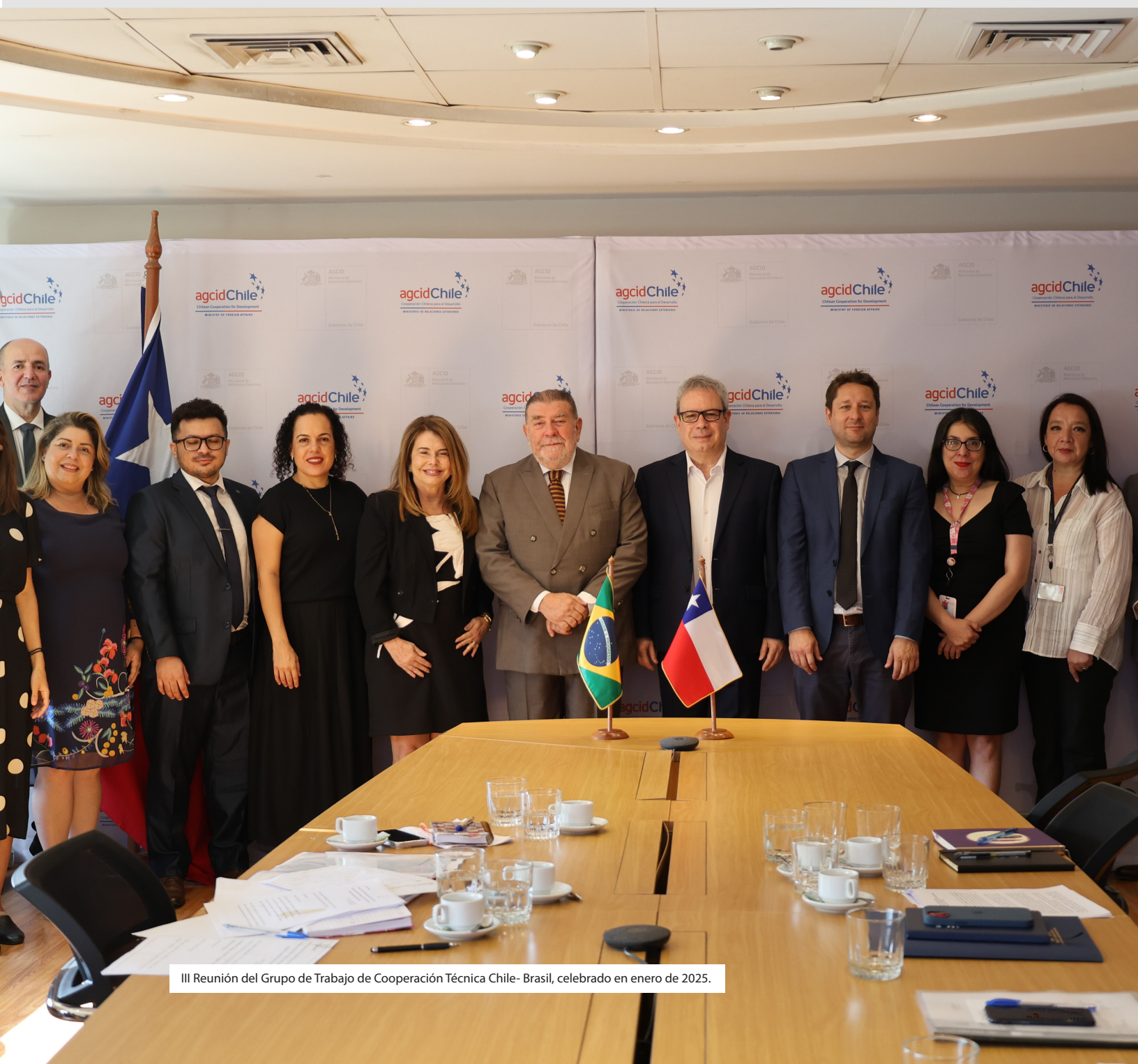
III Reunión del Grupo de Trabajo de Cooperación Técnica Chile- Brasil, celebrado en enero de 2025.

Las reuniones del Grupo de Trabajo (Santiago 2010, Brasilia 2019 y Santiago 2025) funcionan como instancias de definición programática y coordinación técnica. La III Reunión en enero de 2025 aprueba un programa plurianual 2025-2027 centrado en energía, justicia, propiedad intelectual y salud, con la participación de contrapartes técnicas como la Comisión Nacional de Energía, la Defensoría Penal Pública, el Instituto de Salud Pública e institutos de propiedad intelectual. Ese acuerdo reafirma la cooperación sur sur como eje estratégico y promueve la integración de iniciativas subnacionales y la movilidad profesional entre agencias.